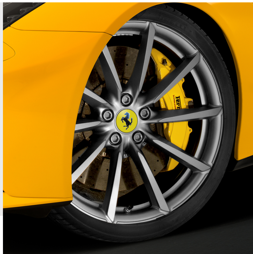
Genuine 20 英寸锻造车轮, 哑光赛车灰油漆饰面