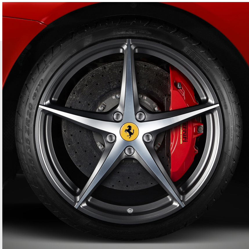
Genuine 20 英寸锻造车轮, 5 辐, 双色调金刚石亮光