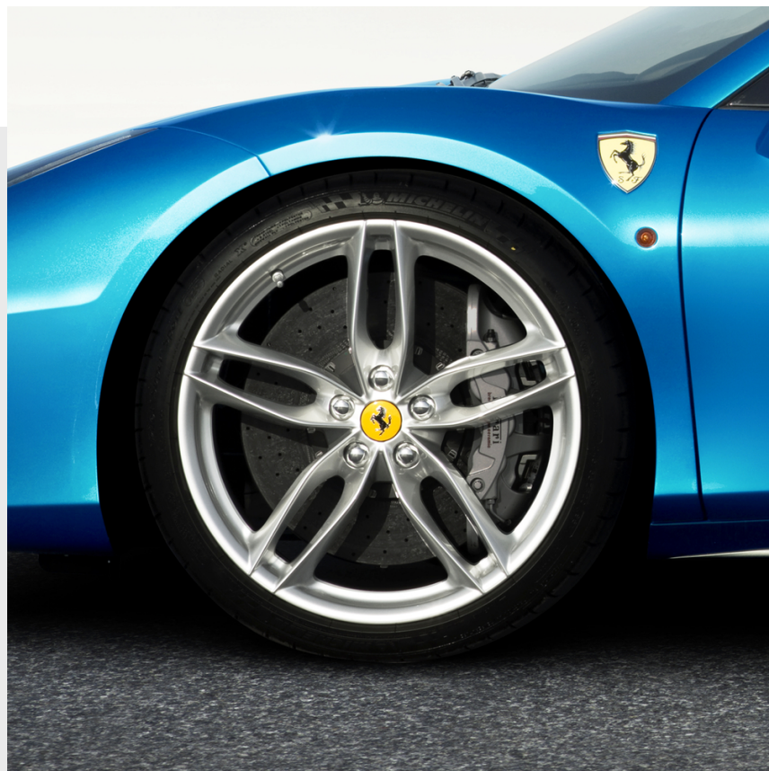
20 インチ鍛造ホイール, 塗装仕上げ、クロム