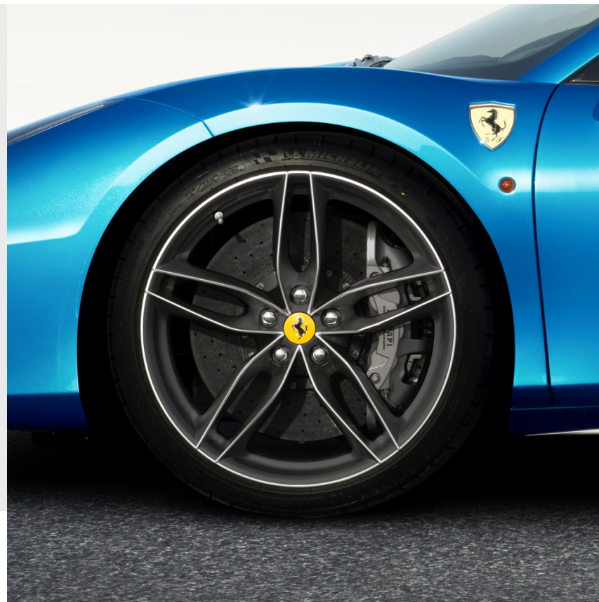
20 インチ鍛造ホイール, ツートンダイヤモンドフィニッシュ