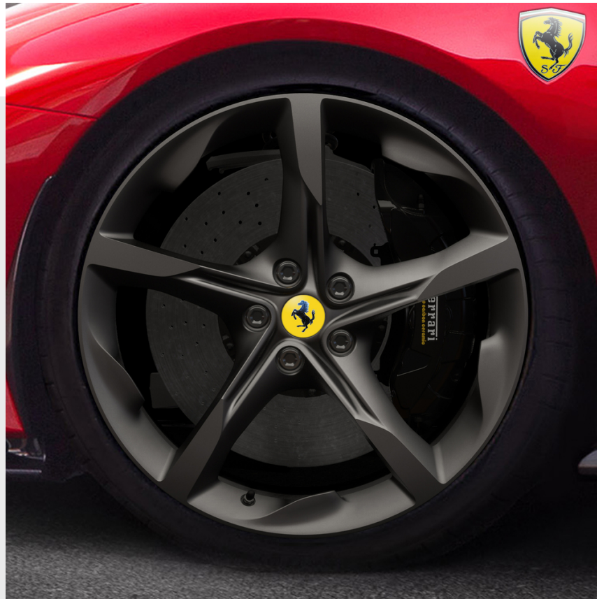
Cerchi 20" forgiati, Grigio Corsa opaco