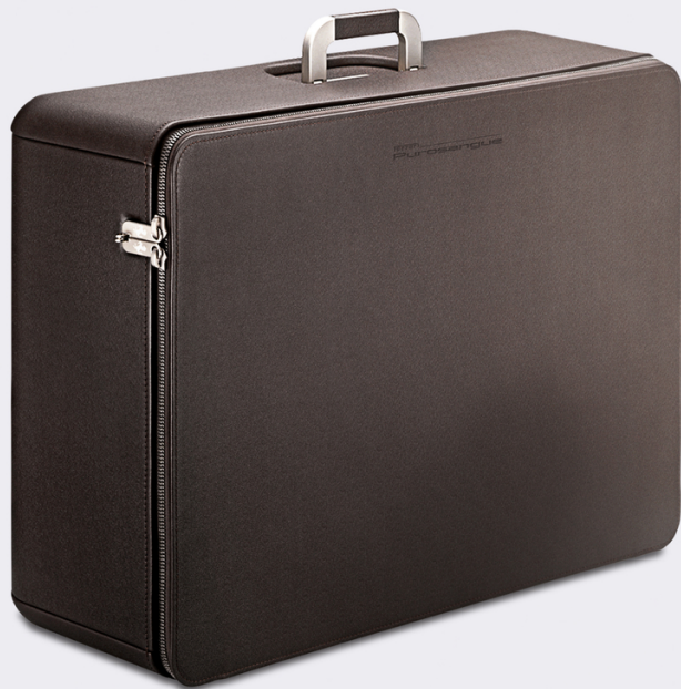
Valigeria Marc Newson, Valigia