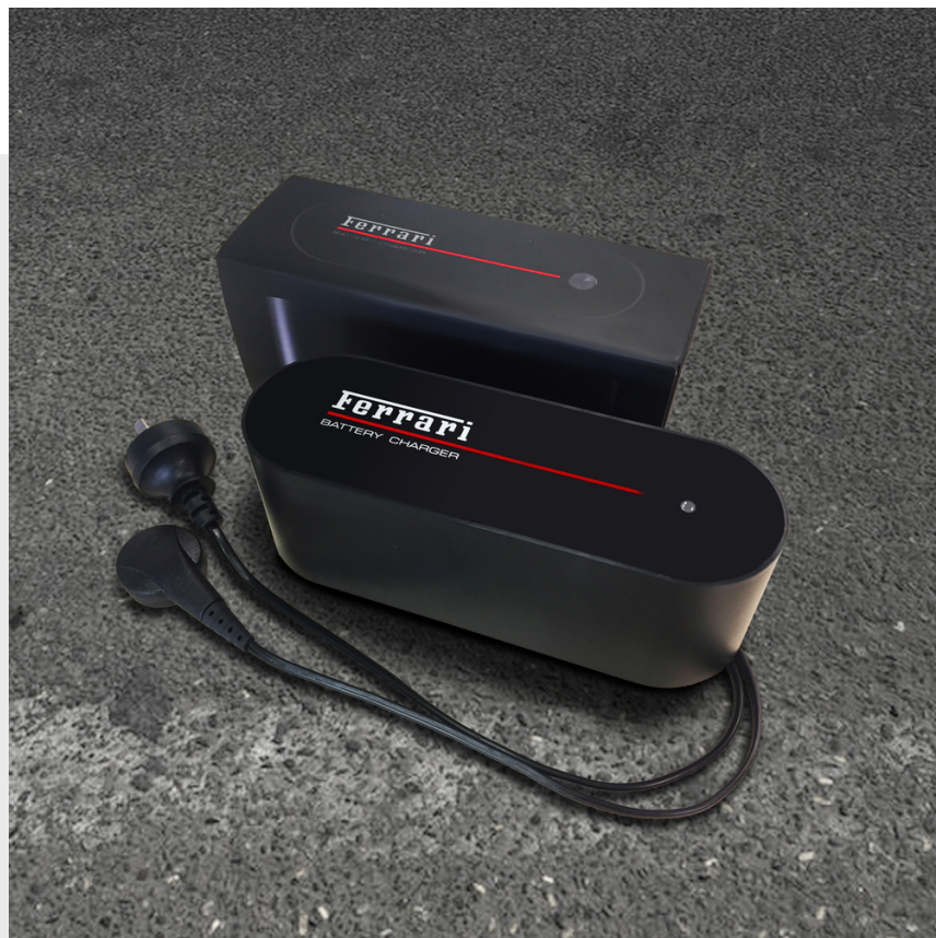
Mantenitore di carica