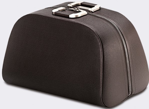
Valigeria Marc Newson, duffel bag