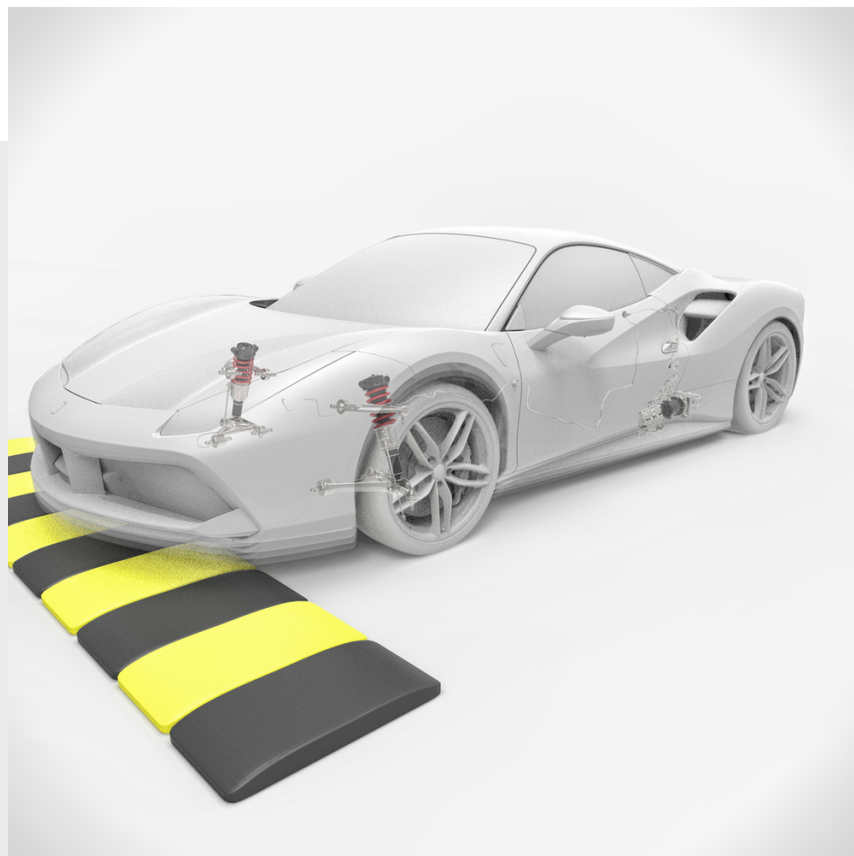
Sollevatore anteriore di disimpegno