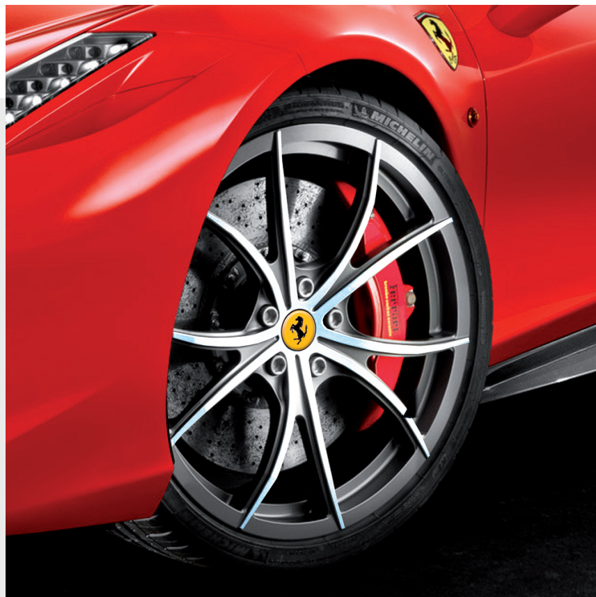
Cerchi 20" forgiati Genuine, multirazza Grigio Corsa diamantato