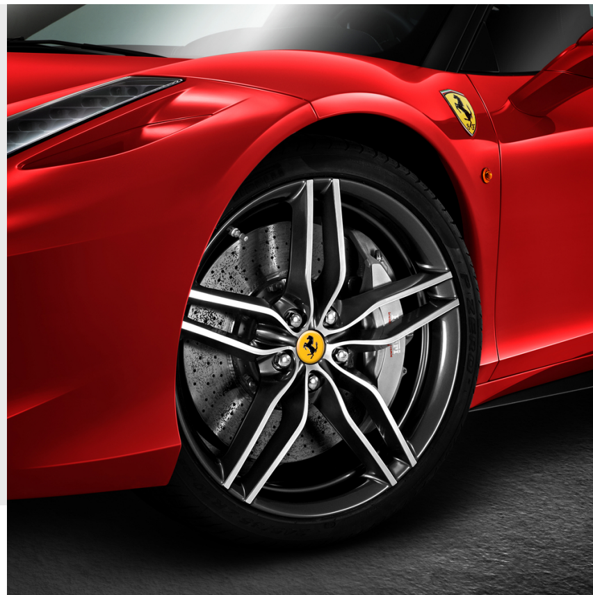
Cerchi 20" forgiati Genuine, bicolore diamantato