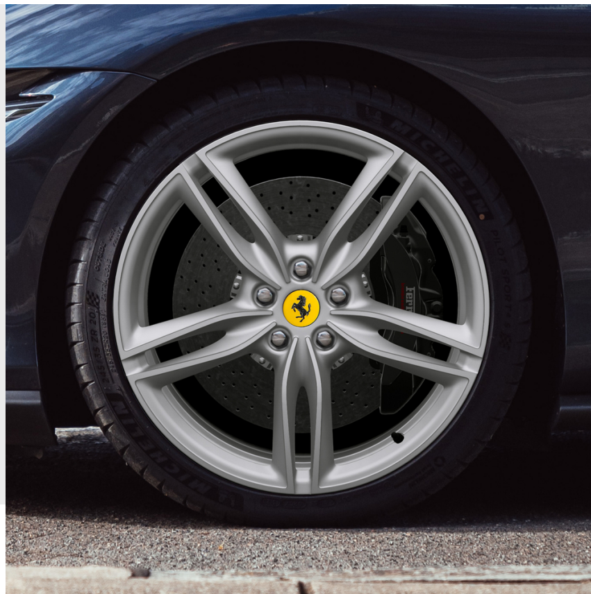
Jantes 20" forgées, Liquid Silver