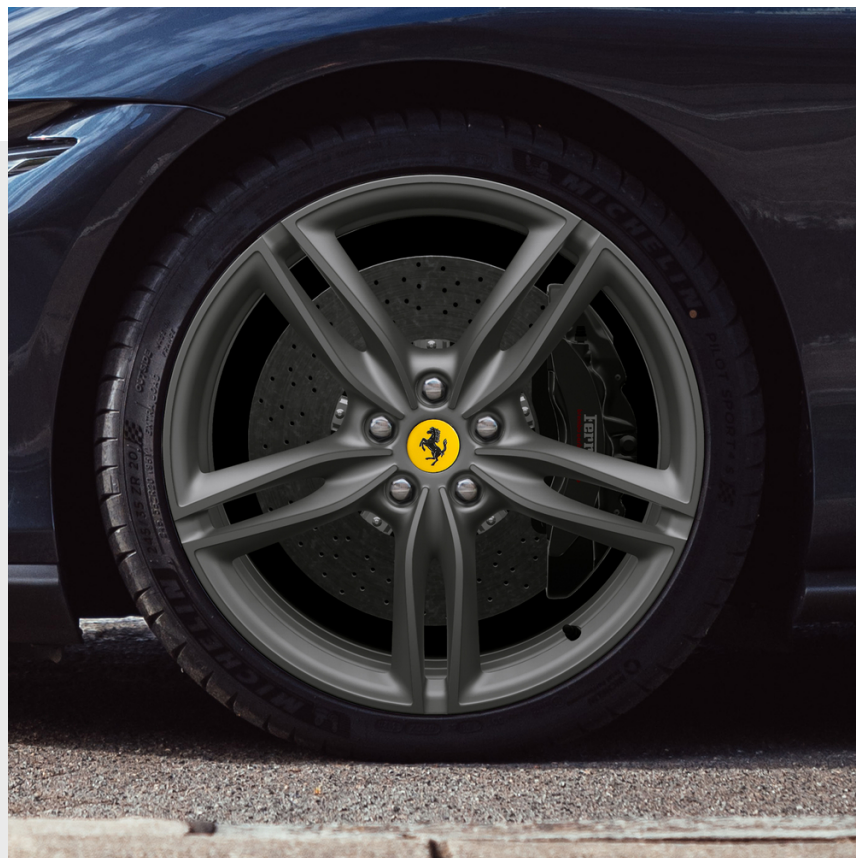
Jantes 20" forgées, Grigio Corsa mat