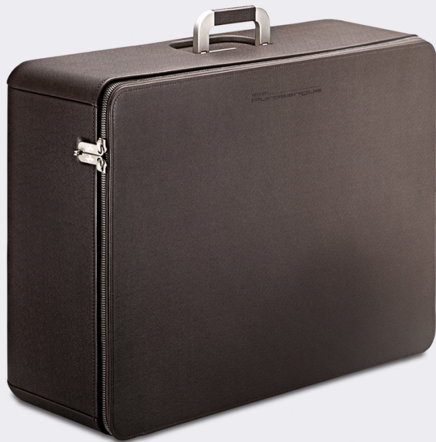
Bagages Marc Newson, Valise