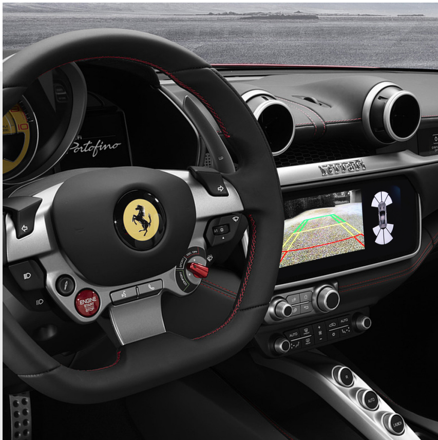
Caméra d'aide au stationnement, arrière