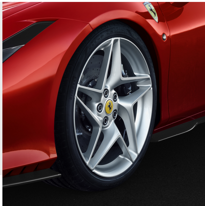
Jantes 20" forgées, peintes chromées