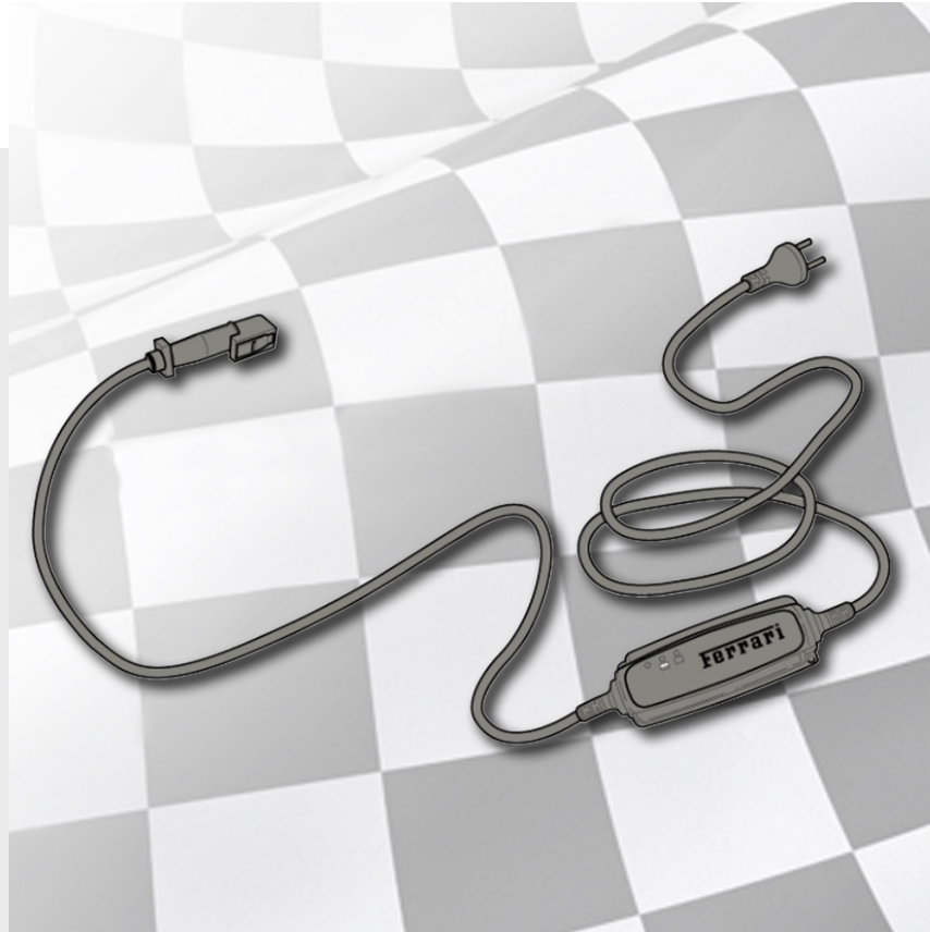
Dispositif de maintien de la charge, batterie au lithium