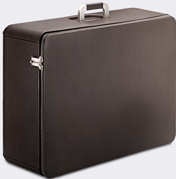
Bagages Marc Newson, sac de voyage