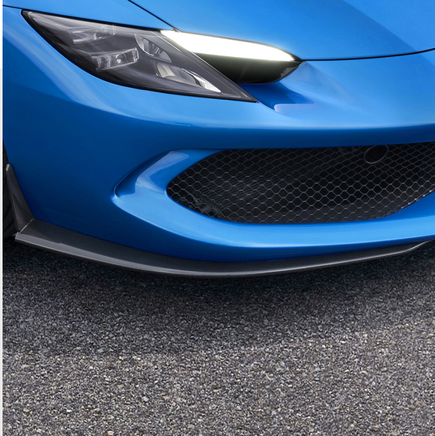
Appendices aérodynamiques avant en fibre de carbone