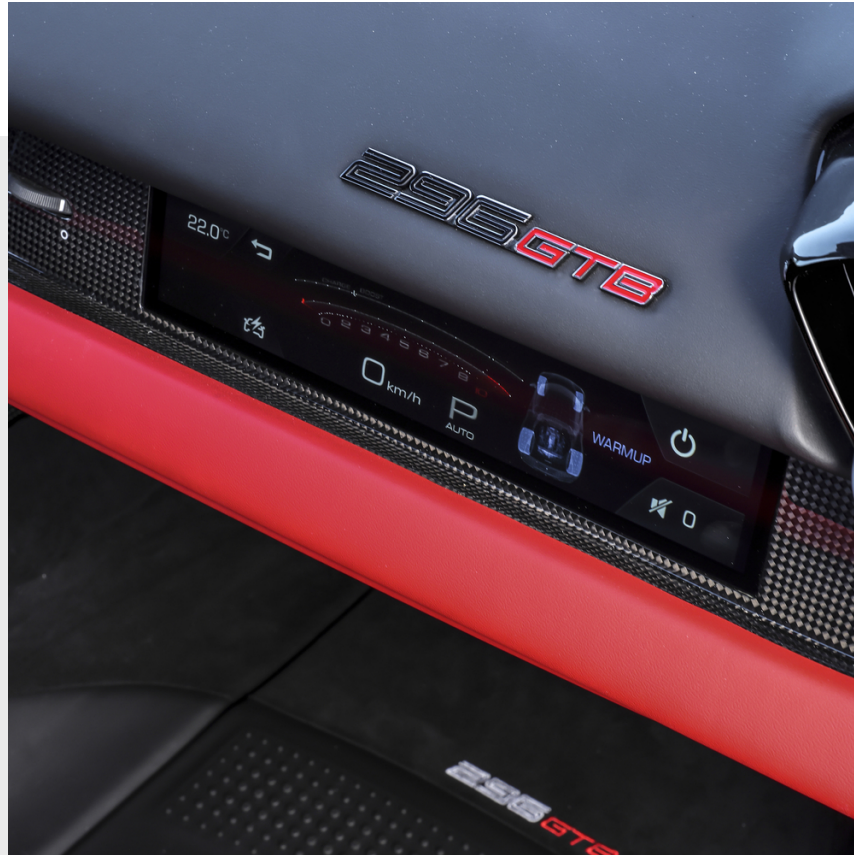
Inserts planche en fibre de carbone, opaque