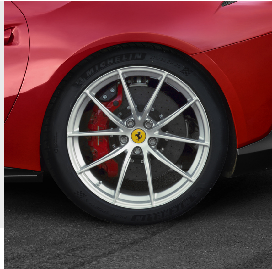
Jantes 20" multibranches forgées, bicolore diamantées, avec goujons en titane