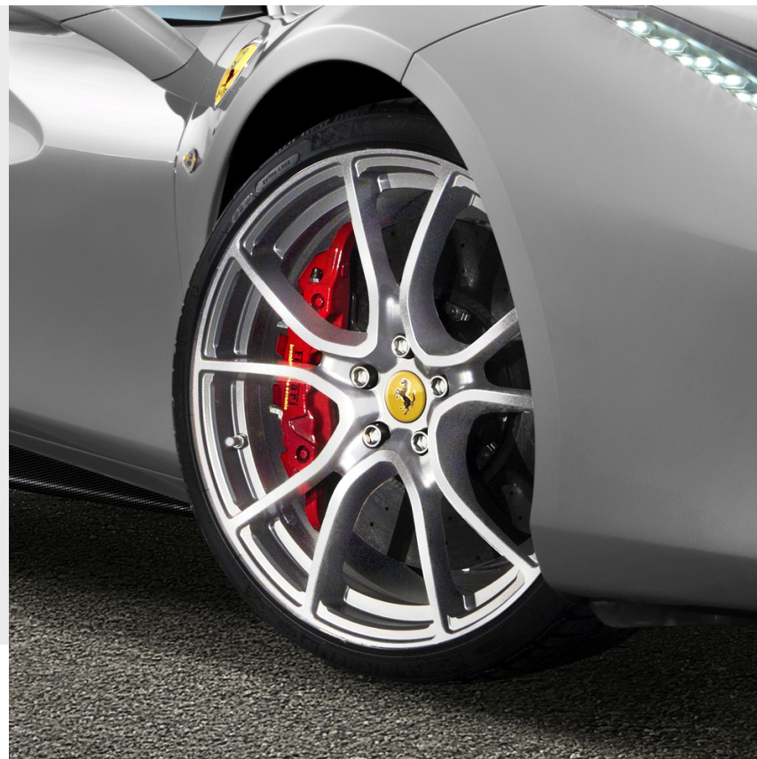
Jantes 20" forgées Genuine, multibranches peintes Race Silver