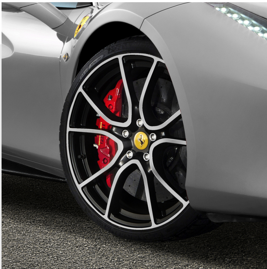
Jantes 20" forgées Genuine, multibranches noire brillante diamantée