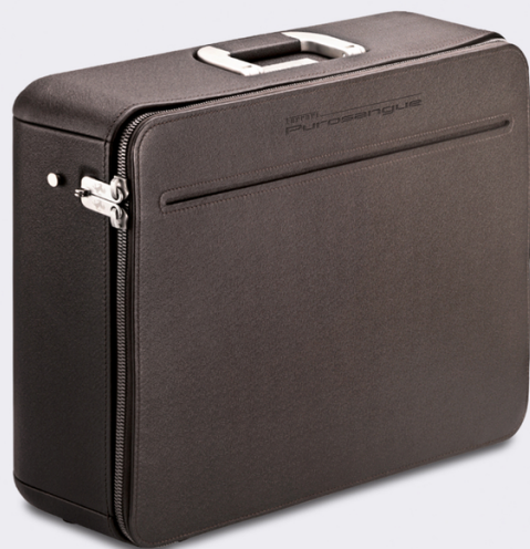
Equipaje Marc Newson, Maletín 24h