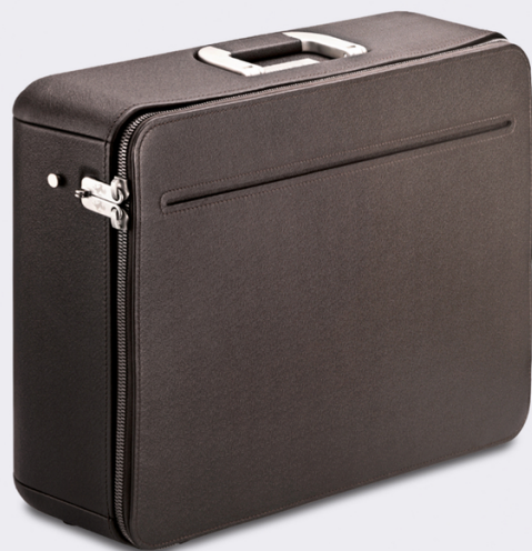
Equipaje Marc Newson, maletín 24h