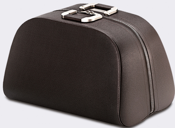
Equipaje Marc Newson, bolsa de lona