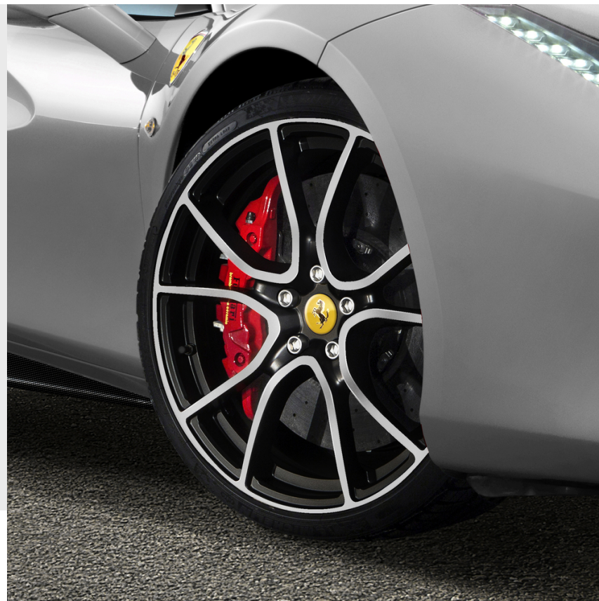
Llantas 20" forjadas Genuine, multirradio negro brillante diamantado