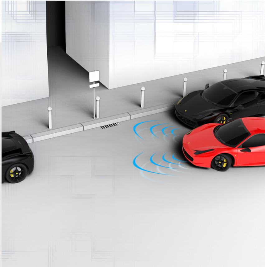
Sensores de aparcamiento, delanteros