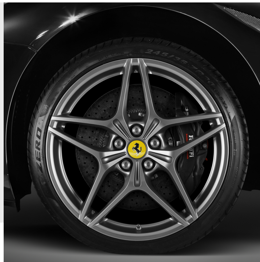
20-Zoll-Schmiedefelgen, Grigio Corsa matt