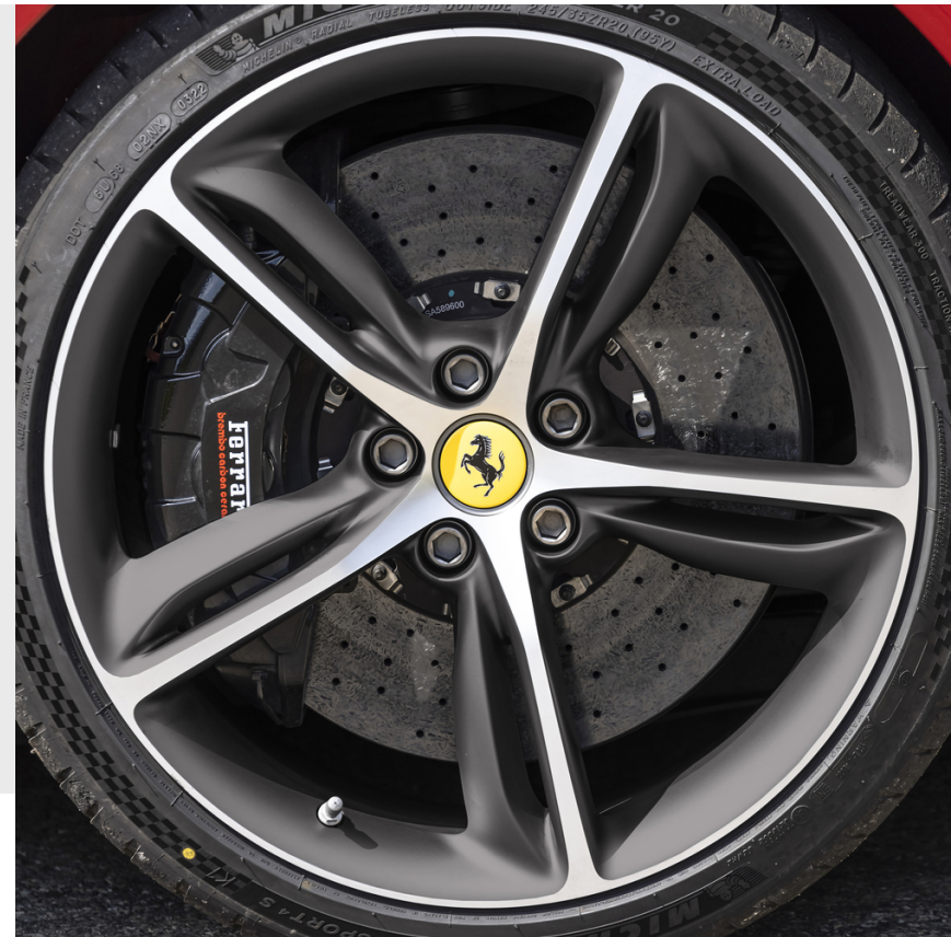
20-Zoll-Schmiedefelgen, Grigio Corsa matt diamantpoliert